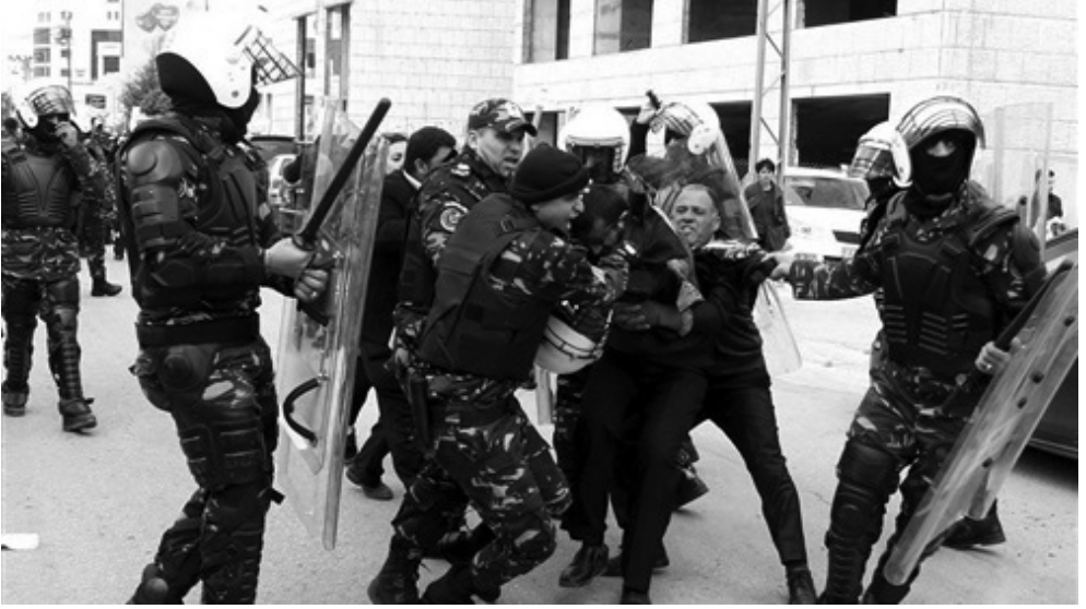
دور أمن سلطة الحكم الذاتي الفلسطيني